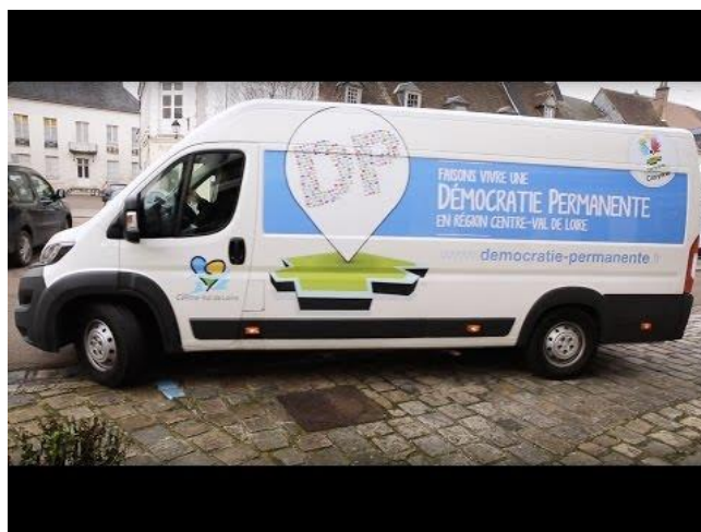
Vidéo : Tournée citoyenne de la démocratie permanente sur la chaîne Démocratie ouverte

La vidéo ci-contre présente la démarche.